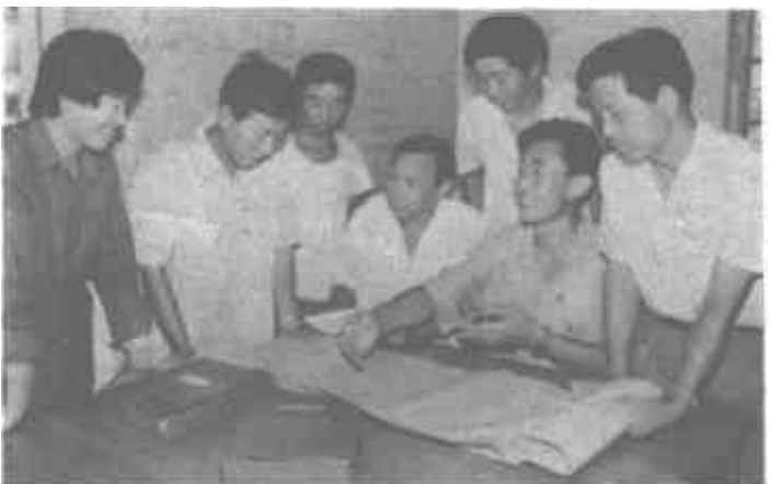
图为市水利建设工程处领导在与技术人员研究施工方案。