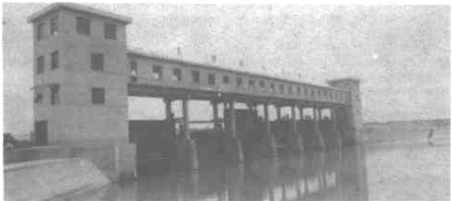
图为省全优工程——支脉河西马楼拦河闸全貌。该闸是建市十年来建成的投资规模最大的河道拦水建筑物。

市水利局在开工报告批复中，对拦河闸施工总的要求是：“加强领导力量，加强施工技术力量，加强施工管理，确保工程质量，确保开竣工时间，争创省厅施工优质安全工程”。市水利建设工程处根据工地实际组织设立了钢筋、木工、混凝土、砌石、机电、降水、机动、安装等9个施工小组。全工地管理人员15人、技工60人，民工80人，最高出勤人员235人。为保证质量和工期，他们科学调度，将整个工期分为3个阶段，逐一推进。他们对施工场地进行了合理布置，既考虑了运输车辆进出方便，又本着少用临时占地、不占耕地、充分利用河堤的原则，使整个施工场地布局合理，施工方便，经济安全。