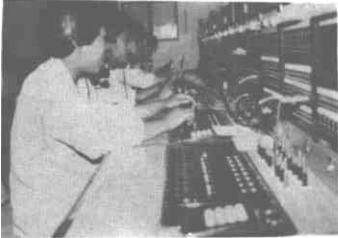
利津县邮电局话务班狠抓服务质量，连续四年被省邮电局评为全省“红旗电路”。图为该局话务员在接续电话。

本报讯 日前，东营区委、区政府重奖了在1992年度全市考核列为前10名的辛店、牛庄、西范、海河、泰安五个乡镇、办事处的党政主要领导、分管领导和计生办主任，分别重奖2000元。